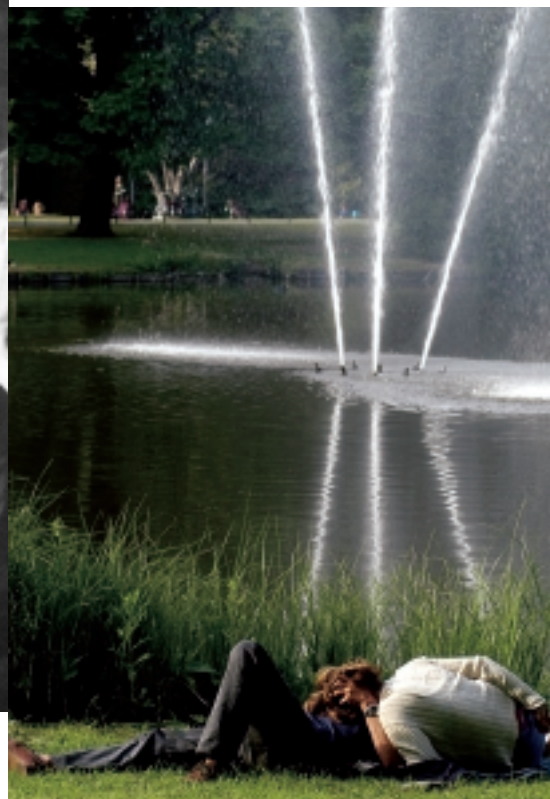
Bijna een kwart van de aangedragen romantische herinneringen heeft het Vondelpark als decor.