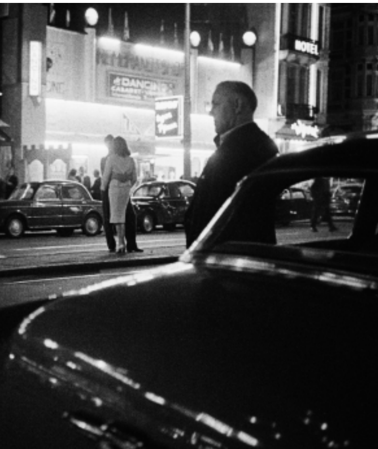
In het uitgaansleven worden contacten gelegd en kunnen stelletjes volop verliefd zijn. Zoals op het Rembrandtplein, dat in onze toptien een gedeelde vijfde plaats bezet. Foto 1959.