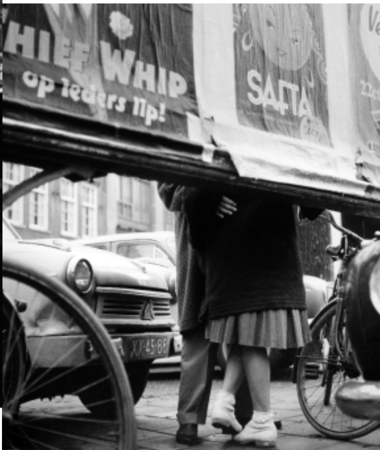
Op de drukke Nieuwezijds Voorburgwal, toch nog een béetje uit het zicht. Foto december 1957. KORS VAN BENNEKOM

kenen zich het liefst herinneren. Ten tweede: onze toppers-lijstjes zijn minder exact dan ze lijken, want waar de een tot op de straathoek nauwkeurig is (“in het Vondelpark, in een boom die over het water hangt, vlakbij het kinderbadje”, of “op de Prinsengracht voor nummer 181, net ten zuiden van de Prinsenstraat”), heeft een ander het vaag over “een park” of “de Amstel”. Dat maakt het rangschikken lastig.