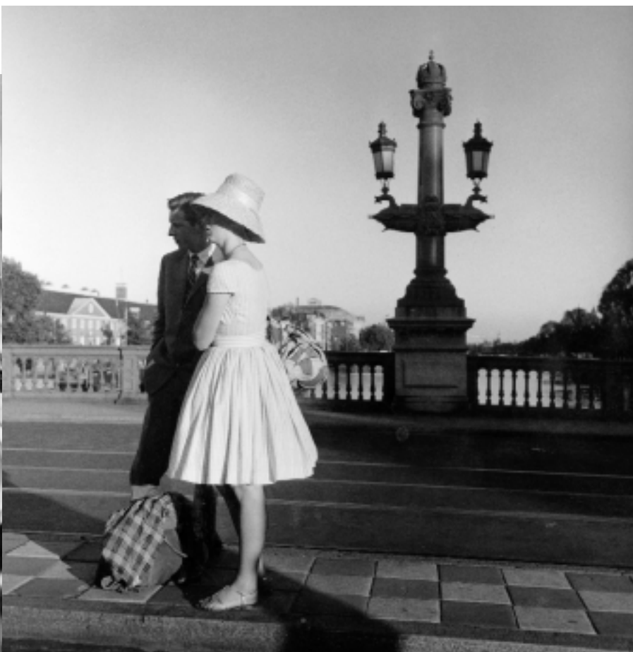
Bruggen hebben een bijzondere aantrekkingskracht op verliefden. Zoals de Blauwbrug over de Amstel. Op deze foto uit 1955 zien we Carré op de achtergrond.